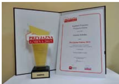
Statuetka i dyplom „Przyjaznej Gminy”