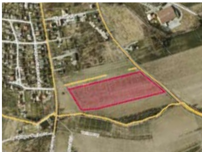
Kompleks działek przeznaczonych pod budownictwo jednorodzinne

Jakiego typu inwestycje byłyby przez gminę najmilej widziane?