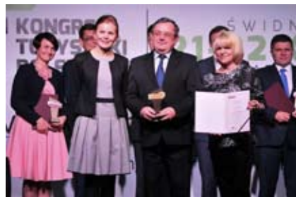
Zastępca Burmistrza odbiera tytuł „Przyjaznej Gminy”

21 października gmina Sobótka otrzymała certyfikat dla Przyjaznej Gminy miejsko-wiejskiej. Nasza Gmina Sobótka znalazła się w gronie Laureatów konkursu organizowanego przez redakcję ForumBiznesu.pl „Przyjazna Gmina 2015 – Samorząd 25 lecia” w kategorii „Gmina miejsko-wiejska”. Podsumowanie programu wraz z wręczeniem nagród odbyło się w Świdnicy podczas Konferencji Przygotowawczej Kongresu Turystyki Polskiej. Przyjazna Gmina to program mający na celu m.in. wyłonienie najlepszych samorządów w Polsce, wskazanie kierunków rozwoju, a także promocję Gmin w zakresie gospodarczym, społecznym, ekologicznym, turystyczno-przyrodniczym i historyczno-kulturowym. W programie brano pod uwagę m.in. ofertę inwestycyjną gminy, walory gospodarcze, dostęp do infrastruktury technicznej, inwestycje w kontekście planu zagospodarowania przestrzennego, skuteczność działań promocyjnych, walory przyrodnicze, geograficzne, tradycje gospodarze, instytucje kultury i edukacji oraz otwartość miejscowych społeczności wobec inwestycji zewnętrznych.