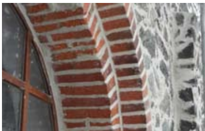
Ubytki zostały uzupełnione zaprawą konserwatorską Trass-Kalk Fugenmörtel.

Zapraszamy na pasterkę na Ślęży, która rozpocznie się 24 grudnia o północy w kościele na szczycie Ślęży. Przed Mszą koncert kolęd artystów scen operowych Wrocławia i Gdańska.