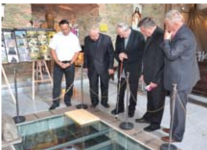
Kard. Joachim Meisner zwiedzał świątynię wraz z arcybiskupem wrocławskim.