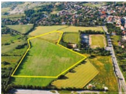
Teren inwestycyjny w okolicy Stadionu Miejskiego

Pierwszy teren o łącznej powierzchni ok. 30 ha, położony w bezpośrednim sąsiedztwie stadionu sportowego, z przeznaczeniem na usługi w zakresie sportu i turystyki (np. parki rozrywki, hale sportowe, kąpieliska otwarte, pływalnie kryte czy boiska sportowe sezonowo wykorzystywane pod lodowisko). Drugi teren to kompleks 25 działek o powierzchni od 900-1400m 2 , przewidzianych pod budownictwo jednorodzinne z pięknym widokiem panoramy góry Ślęza, blisko Rynku. Trzeci teren to grunt pod zabudowę przemysłową o powierzchni 24 ha w miejscowości Wojnarowice.