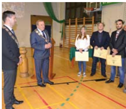
Burmistrz wręcza nagrody sportowcom

Na terenie gminy istnieje dużo klubów sportowych gdzie można trenować m.in. judo, karate, grę w piłkę nożną, kolarstwo, badminton, biegi. W większości tych dziedzin przyznawane są nagrody finansowe za osiągnięcie przez zawodników wysokich wyników. Gmina Sobótka wspiera