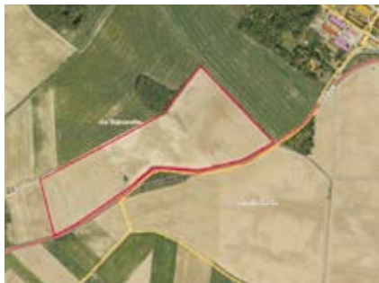
Grunt pod zabudowę przemysłową w miejscowości Wojnarowice

Strona internetowa jest obecnie modernizowana pod kątem wprowadzania nowej oferty oraz formy prezentowania nieruchomości. Chcemy aby w jednym miejscu znajdowały się wszystkie nieruchomości gminne do sprzedaży. Na stronie prezentowane będą również aktualne przetargi.