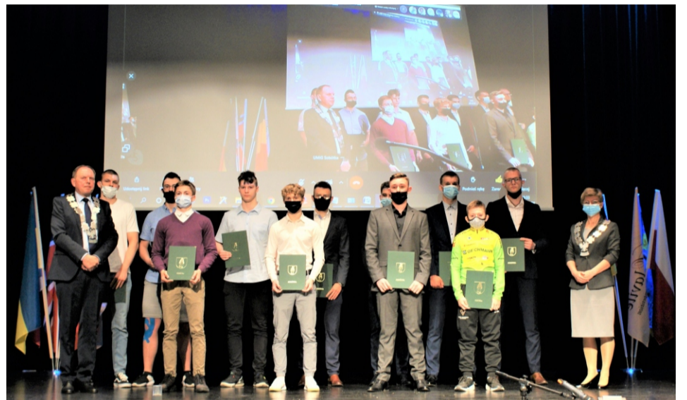
■ Sportowcy z gminy Sobótka