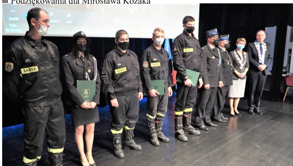
■ Przedstawiciele OSP z gminy Sobótka