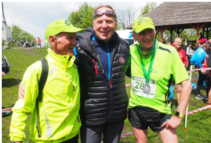
■ Burmistrz Sobótki gratuluje biegaczom