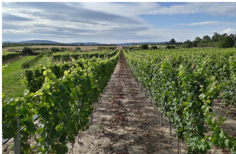
■ Winnica w obrębie Sobótki