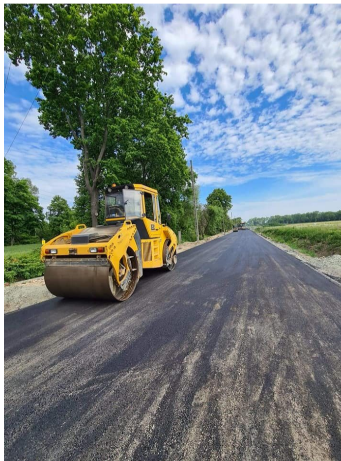
■ III etap remontu ulicy Zmorskiego w Sobótce Zachodniej