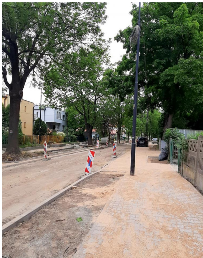
■ Remont ulicy Stacyjnej i Dworcowej w Sobótce

Oprócz poszukiwań oferentów na dokumentacje projektowe, wyłoniono Wykonawców na realizację innych zadań inwestycyjnych: